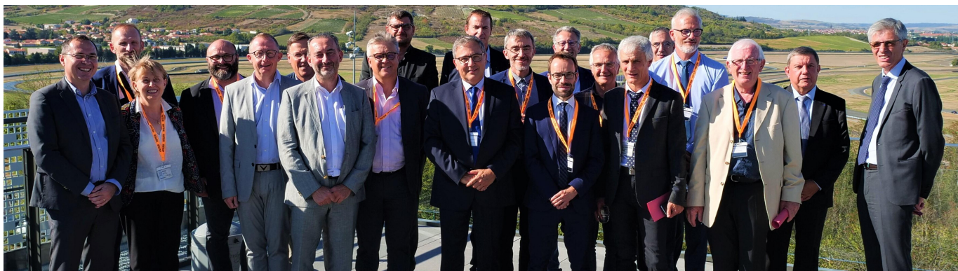
Le nouveau conseil d'administration de CIMES