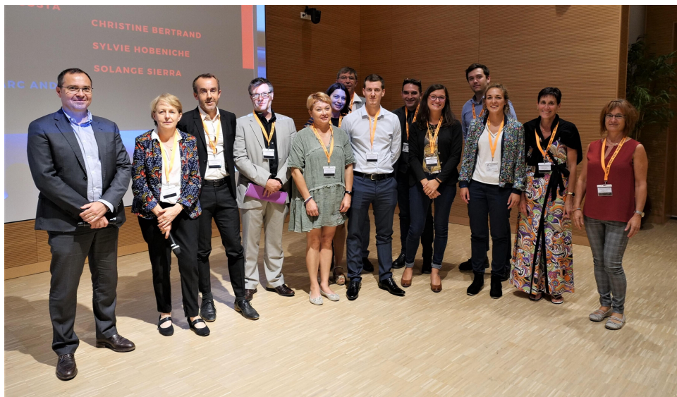
La nouvelle équipe CIMES...